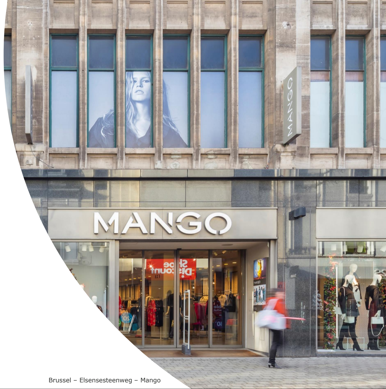
Brussel – Elsensesteenweg – Mango