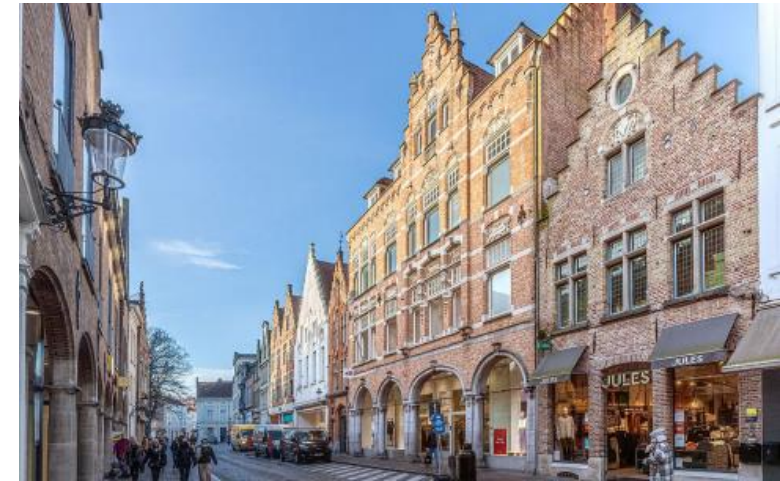
Brugge – Steenstraat 80– H&M