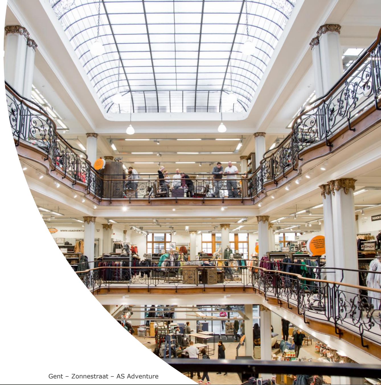
Gent – Zonnestraat – AS Adventure