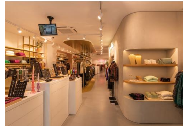
Mechelen – Bruul 39-41 – My Jewellery