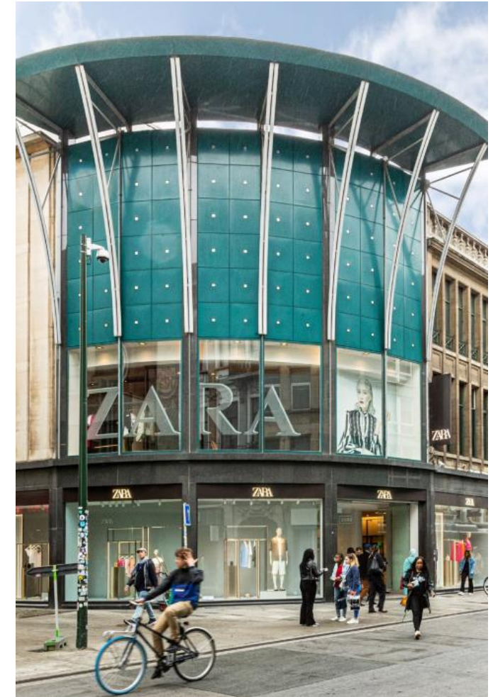
Brussel – Elsenesesteenweg 41-43 - Zara

Bron: De marktinformatie is mede gebaseerd op de volgende bronnen: Retail Focus – verschillende nummers januari – december 2023.