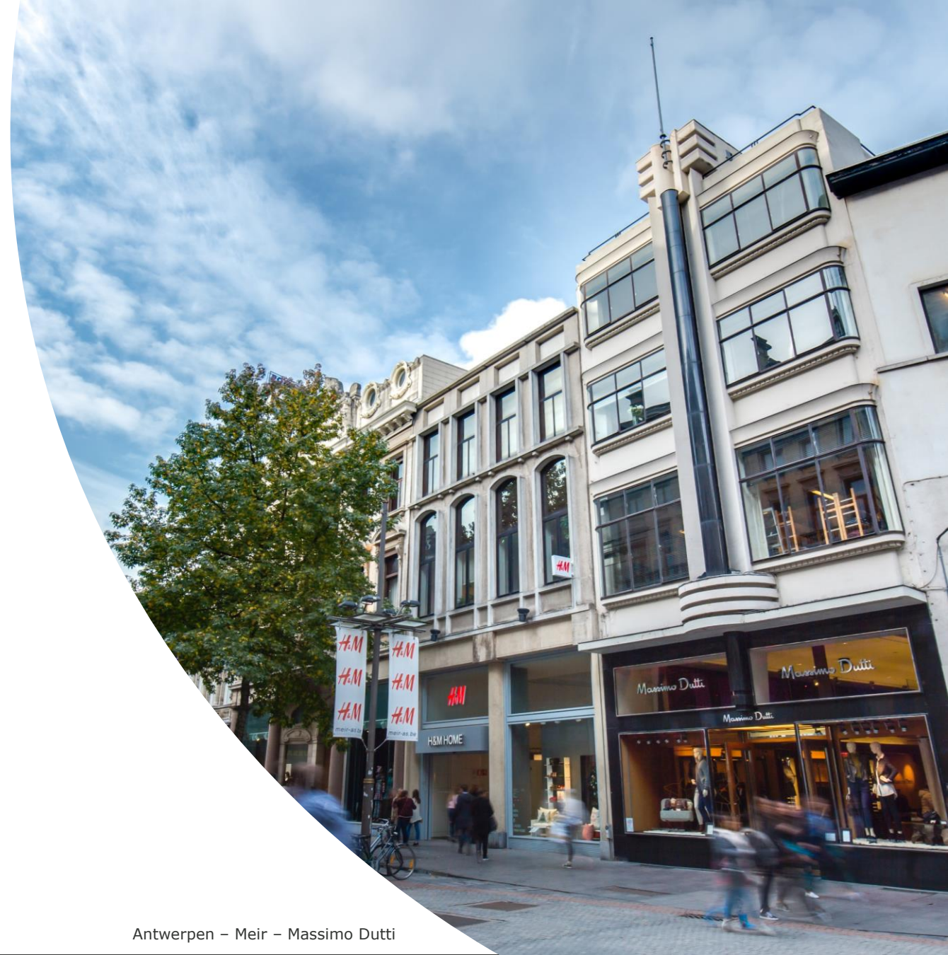
Antwerpen – Meir – Massimo Dutti