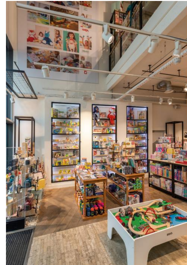
Gent – Zonnestraat 10-12 - Fox