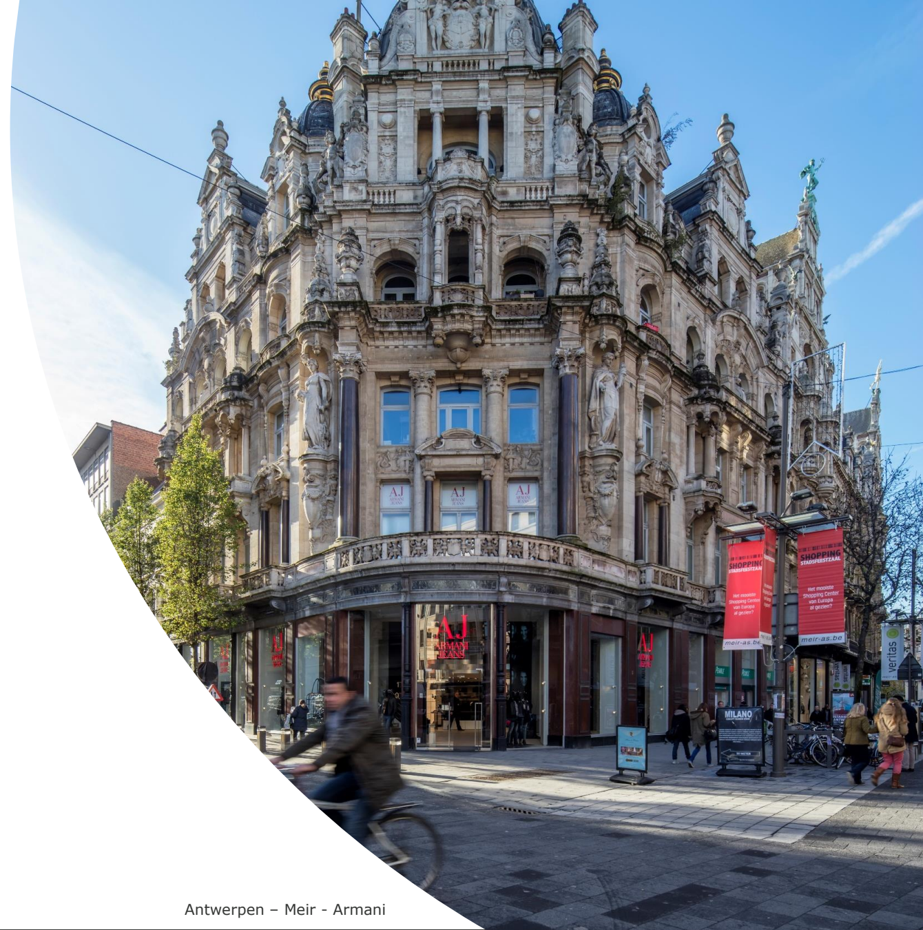
Antwerpen – Meir - Armani