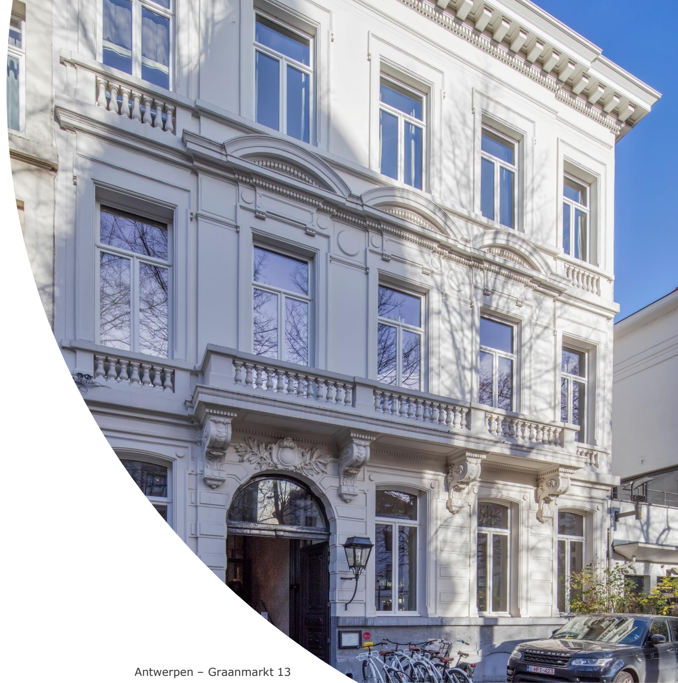
Antwerpen – Graanmarkt 13