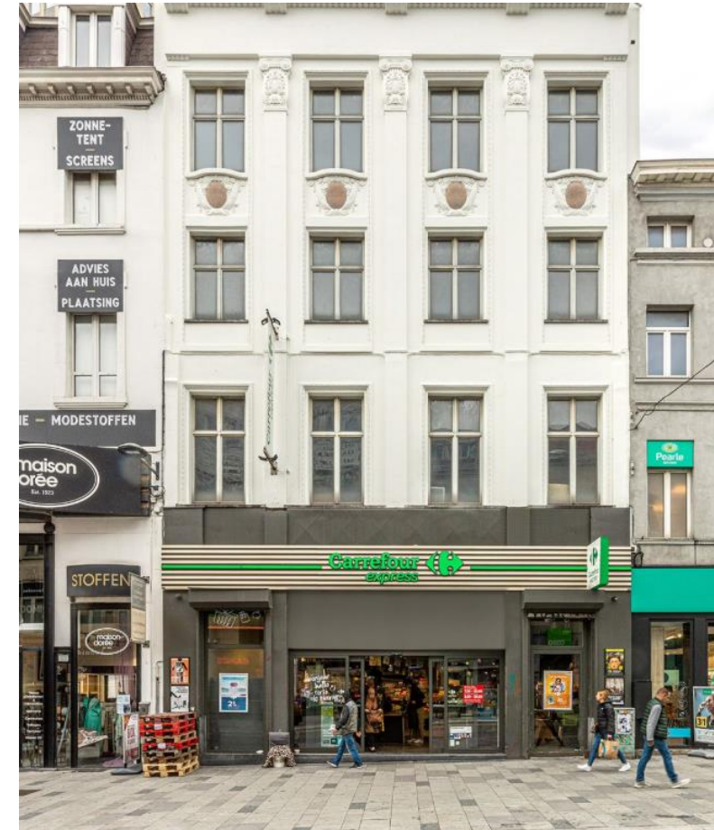
Brussel – Elsensesteenweg 16 – Carrefour

Bron: De marktinformatie is mede gebaseerd op de volgende bronnen: Retail Focus – verschillende nummers januari – december 2023