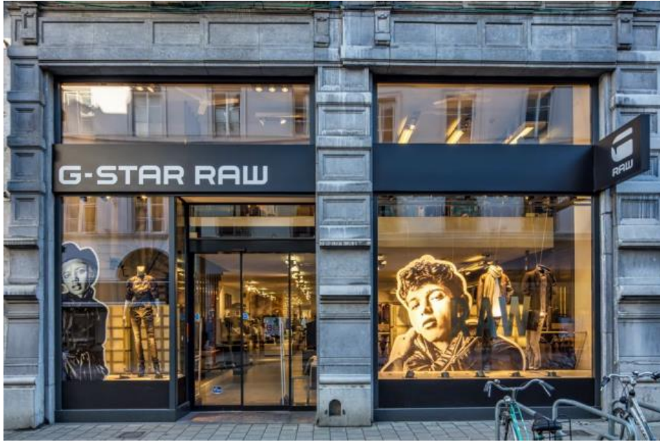
Gent – Voldersstraat 15 – G-Star